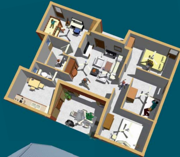
Piment T3 - T5